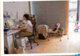
玄関前で遊ぶ子供の声を聞きながらお仕事中です。

大きなドアを開けるとそこは土間のカーポート。雨に濡れずにも車を乗り降りできてとても便利。そのすぐ横には奥様の仕事スペース。子供が帰ってくる時一番に顔が見れる特等席なんです。