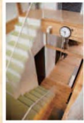
量が気持ちいいの階段の踊り場で子供が寝転んでいることも。

スクエアプラスの家づくりを ほんのちょっと ご紹介!! 土地の大きさ、 建物が建てられる面積は決まっています。 でも同じ大きさの中に アイデアと工夫をつめこむだけで 豊かな空間になるんです!