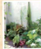
小さいながらもウッドデッキにはグリーンコーナーが、夏にはトマトが採れるんです。