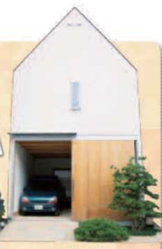
なんととってもこのトンガリ屋根と大きなドアが目印!