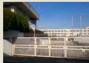
市立住吉小学校700m(徒歩約8分)