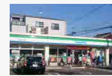
ファミリーマート(徒歩約3分)