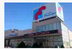
万代南住吉店(徒歩約8分)