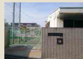
市立住吉中学校900m(徒歩約11分)