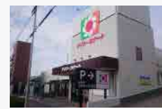
デイリーカナート(徒歩約6分)