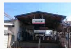
南海高野線「住吉東」駅(徒歩約3分)